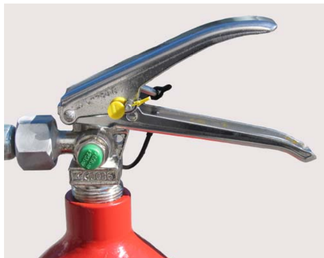
Släckarna har ett robust bärhandtag och en kraftig avtryckare för öppning och stängning av ventilen. En säkring hindrar vådautlösning