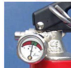
Ventilen är försedd med en lättavläst manometer