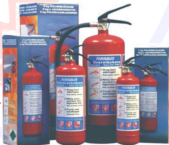
Samtliga modeller utom PK 6 H levereras i en 4-färgs kartong med svenska instruktioner