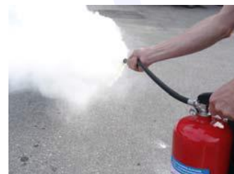
Släckarna har ett robust bärhandtag och en kraftig avtryckare för öppning och stängning av ventilen

1 och 2 kg släckarna har som standard munstycket monterat direkt i ventilen. De större modellerna har en rejält tilltagen slang som gör att man lätt kan arbeta med strålen och sprida pulvret över stora ytor. Som tillbehör finns även slang till 1 och 2 kg släckarna.